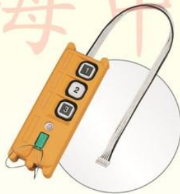
· 拷貝機(複製另一組發射/接收機)